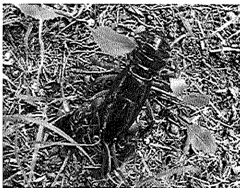
年々生息数が減少するニホンザリガニ