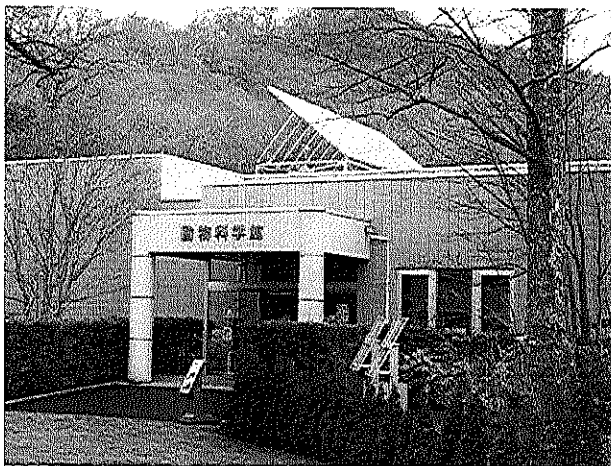
動物科学館に設置している太陽光発電(出力5kw) (特定非営利活動法人 ひまわり種の会設置・所有)