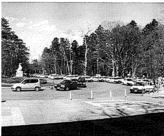
GW中の駐車場入場待ちの例