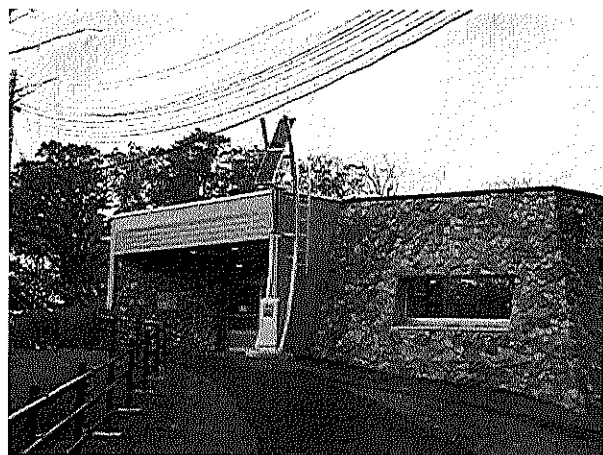
サル山展望レストハウスに設置している 風力と太陽光発電設備