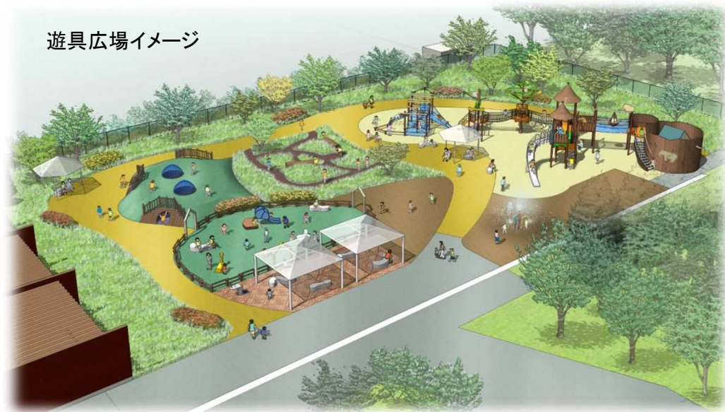
遊具広場イメージ