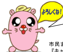
市民まちづくり活動キャラクター 『キャッピー (GAPPY)』

4月に施行される市民まちづくり活動促進条例に基づき、基本計画の策定を行うとともに、市民が行うまちづくり活動に対して人材、場所、情報、資金の面から総合的に支援を行います。