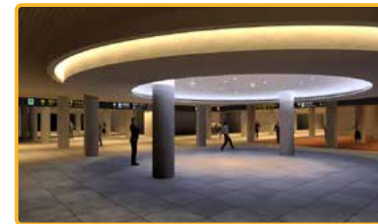
大通交流拠点地下広場整備