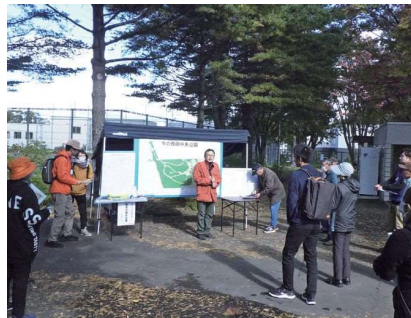
(詳しくは見開きページをご覧ください。) 意見交換会の様子

その後、テニスコート前の広場において、意見や感想を出し合い、今後の西岡中央公園のあり方について意見交換をしました。