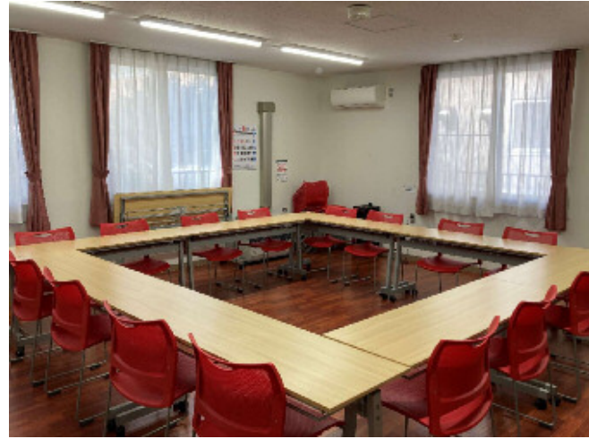
会議室 A (1階) 椅子16脚/会議机8台