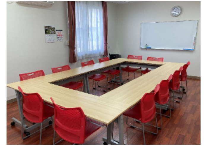
会議室 C (2階) 椅子12脚/会議机6台