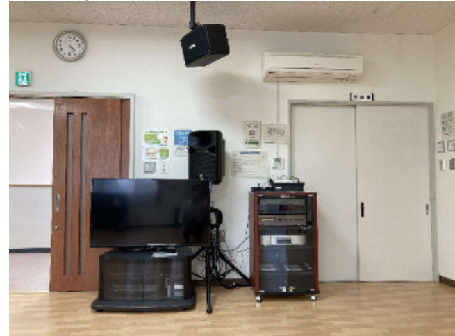
集会室 1 備え付け備品 (音響機器・TV・DVD・CDプレイヤー)