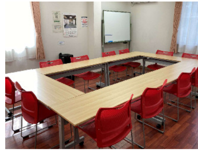
会議室 B (1階) 椅子12脚/会議机6台