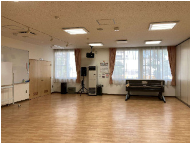
集会室 1 (2階) 椅子105脚/会議机14台