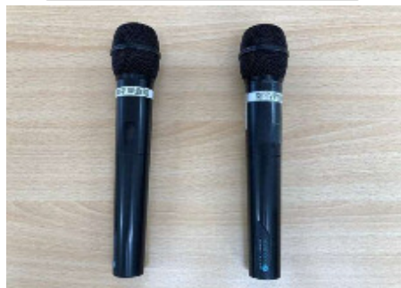
ワイヤレスマイク