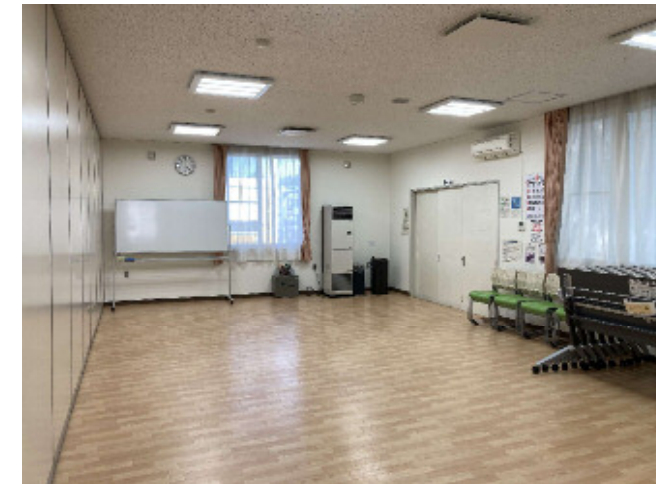
集会室 2 (2階) 椅子20脚/会議机8台