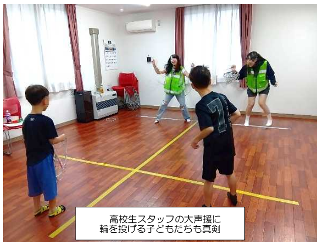
高校生スタッフの大声援に 輪を投げる子どもたちも真剣

参加者からは「何度も何度もゲームに挑戦できて、すごく楽しかった」「家族で参加でき、子どもが喜ぶ姿が嬉しかった」「南平岸会館って一般の人でも使えるのですか!?!」といった好反応が。集う楽しさやあそびの一体感を感じ合えるイベントとなりました。参加いただいた皆さん、学生チームの皆さん、ありがとうございました！