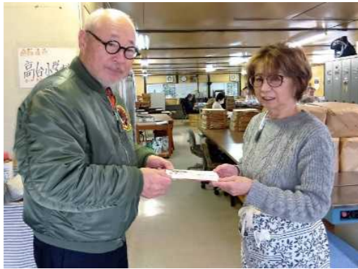
就労継続新B型 ゆったりたんぽぽさん

南平岸にお住いの皆さんの温かいお気持ちに感謝いたします。本当にありがとうございました。