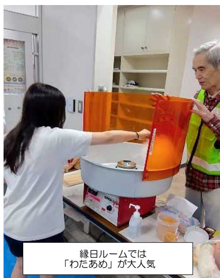
縁日ルームでは 「わたあめ」が大人気