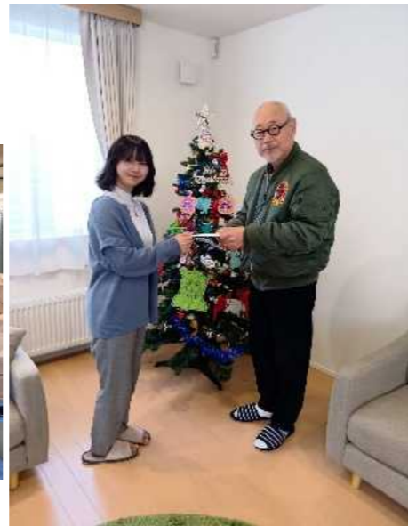
自立援助ホームほみえさん