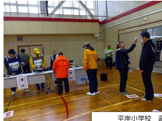
平岸小学校 避難者の受付

また、今年度は、4つの避難所運営グループすべてで、各学校のご協力を得ながら、南平岸地区町内会連合会の「避難所運営マニュアル」を整備しました。今後の研修や実際の避難所開設に活用します。参加された役員の皆さん、会員の皆さん、お疲れさまでした。