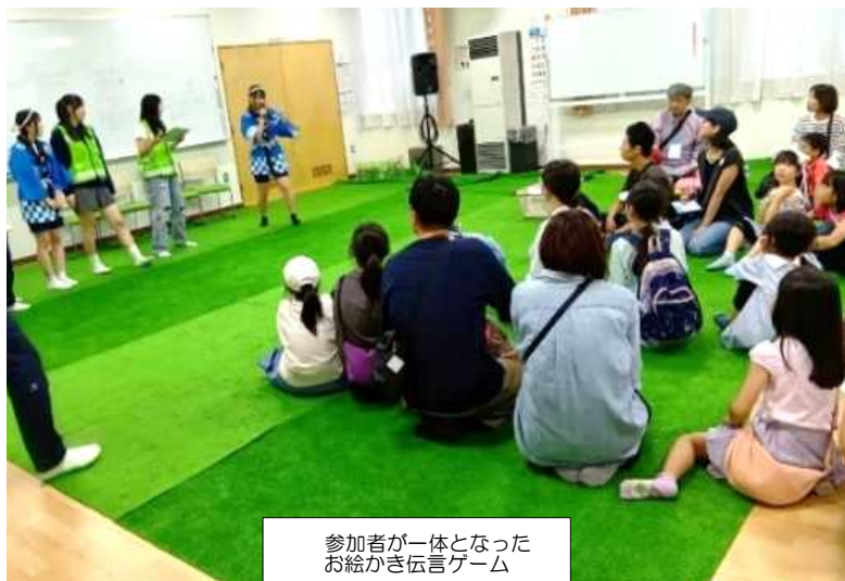
参加者が一体となった お絵かき伝言ゲーム