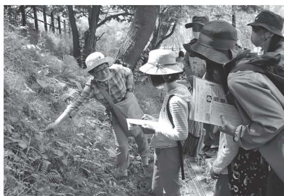
▲体験学習会「ぶらりネイチャー ～初夏のお花ガイド」

令和元年度以降は、各計画に基づく博物館の整備・運営にかかる詳細な調査・検討を進めるとともに、札幌市博物館活動センターにおける博物館活動において、札幌の自然とその成り立ちを学ぶ場の提供や、学校等との連携事業により、引き続き機運醸成を図っている。