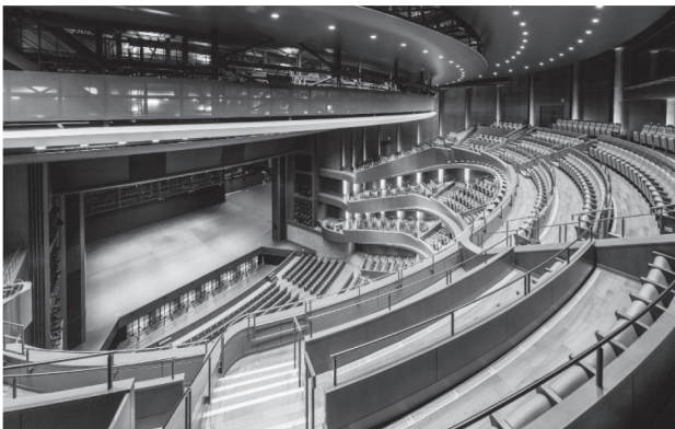
▲札幌文化芸術劇場 (hitaru)

札幌市民交流プラザは、札幌における多様な文化芸術活動の中心的な拠点であるとともに、