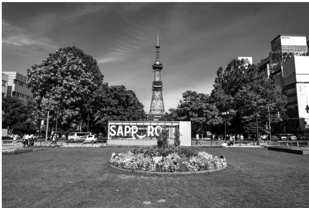
さっぽろテレビ塔