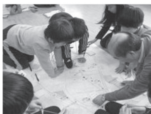
通学路危険場所マップ作製