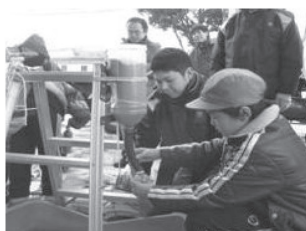
砂入りペットボトル作製体験

この事業では、将来のまちづくりの担い手である“子ども”を中心として、住民・企業・行政の三者が互いに連携し合い、小学生を対象として除雪への理解を深めてもらう雪体験授業、学生や企業等が行う除雪ボランティア活動に対して除雪用具の貸出を行うボランティア支援、地域懇談会、公園の雪置き場活用など、地域との協働によるさまざまな取り組みを行い、除雪における地域力が高まることで、安心・安全で暮らしやすい冬みち環境の構築を目指す。