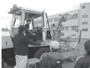
除雪機械試乗体験