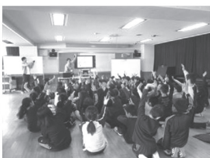
市職員による除排雪の授業