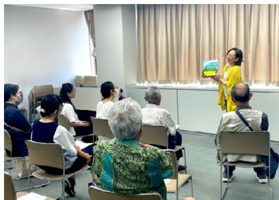
中央図書館での読み聞かせ会の様子 ▶

絵本の読み聞かせに加えて、英語圏の伝承童謡 マザーグースや手遊び歌なども紹介もします。 英語で読む前に、日本語であらすじや見どころを お話しします。 初めての方もどうぞお気軽にお越しください。