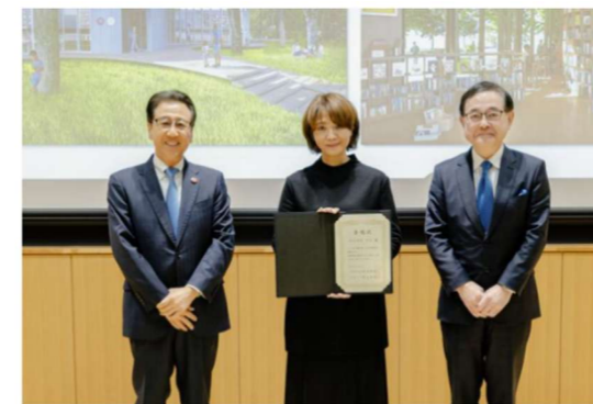
◀令和8年1月30日委嘱状交付式