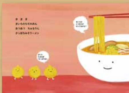
「第1回さっぽろ絵本グランプリ」 準グランプリ作品『さっぽろいろずかん』作/菅原七斗希

札幌の魅力を描く創作絵本コンクールを今年も開催！ 今年のテーマは「さっぽろののりもの」です。市電？地下鉄？ 想像を広げて子どもたちのための絵本を描いてみませんか？