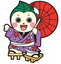
北区まちづくりキャラクター 「ほっぴい」

新琴似や篠路で行われた「農村歌舞伎」と、北区の歴史や伝統を本で巡る展示です。郷土の本だけでなく、歌舞伎の世界がわかる本まで幅広く並べます。本を通じて、私たちの街の魅力を再発見しませんか？