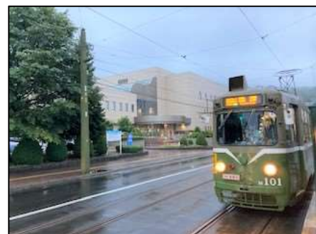
↑ 中央図書館前の「M101号車」

昭和のままの外観と内装に、やや大きな走行音、現役の姿をみられるのもあとわずかです。