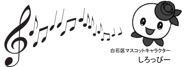
白石区マスコットキャラクター しろっぴー

内容 当館所蔵のクラシックCD、関連する書籍を集めてみました。クラシックは敷居が高い…そんなイメージのある方、気軽に読んで聴いてみませんか？CDは一人2点まで借りることができます。 期間 11月26日（木）～12月22日（火） 会場 1階図書室