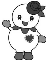
白石区マスコットキャラクター しろっぴー

※今後の状況については、 図書館のホームページ でご確認いただくか、 当館に直接お問い合わせ ください