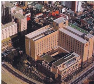
サガミロネッサンスホテル

(昭和62～平成3年度 組合施行) リバーサイドの恵まれた環境と眺望を生かした魅力的なホテル