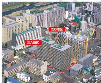
②エクセルシオール豊平橋南 ③エクセルシオール豊平橋南スタア

(②平成12～14年度 ③14～16年度 共同化タイプ) 木造老朽家屋等を解消し、居住環境の向上を実現した共同化型事業