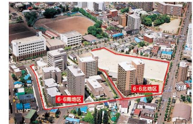
ラポール学園前、札幌留学生交流センター、札幌国際コースホテル