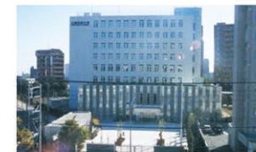
北海道大学、エクセルシオールデュオ学園の杜

南地区に続き事業化した当地区では、権利者複合施設1棟を整備したほか、特定建築者による教育研究施設2棟や地下鉄連絡通路、駐輪場の整備を行いました。また、周辺には、居住機能等への環境に配慮し緩衝緑地帯を設け、居住者だけではなく地域住民に潤いの空間を創出しています。