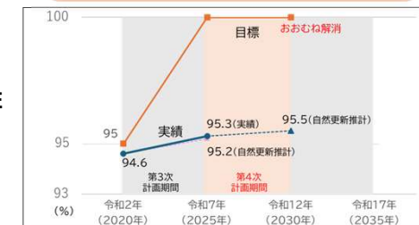
〈多数の者が利用する建築物の耐震化率の推移と目標〉