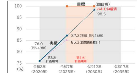
〈要緊急安全確認大規模建築物の耐震化率の推移と目標〉