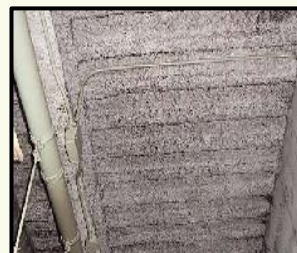
吹付けロックウール