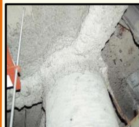
吹付けアスベスト