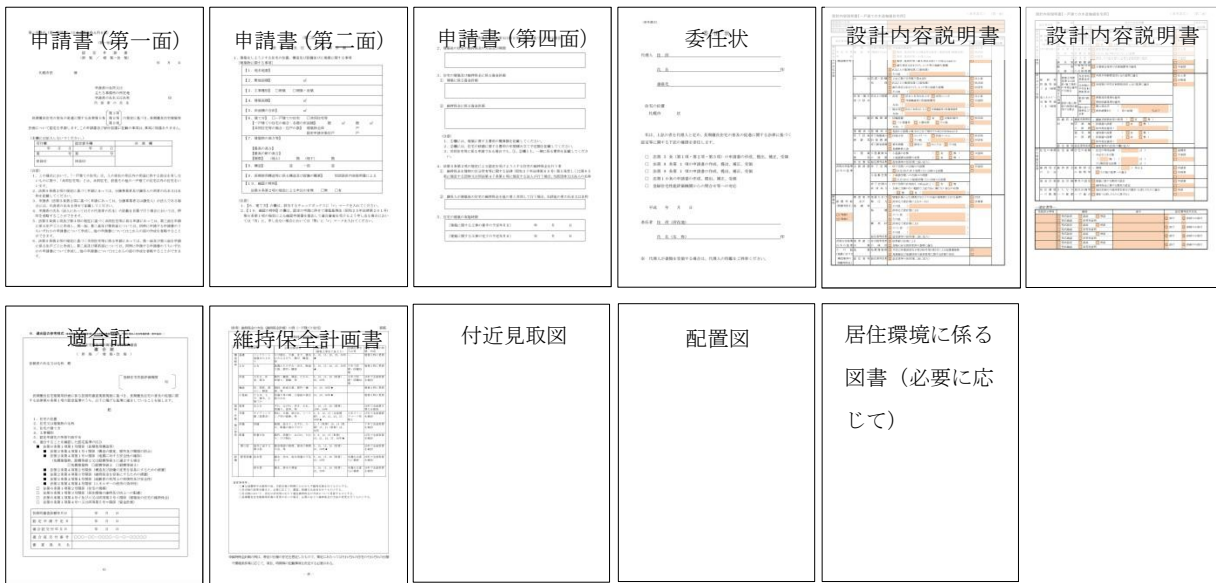
[図1] 省略化した「正本」のイメージ(法第5条第1項申請、新築、一戸建ての住宅の例)