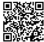
提出フォームはこちら

窓口対応 札幌市中央区北1条西2丁目(市役所本庁舎2階南側7、8番窓口) 9:00 ~ 12:00、13:00 ~ 15:00 ※ 土、日、祝日および12月29日~1月3日を除きます。 ※ 郵送による受付はしておりませんので、オンライン提出をご利用ください。