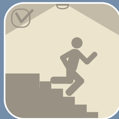
電池の交換・修理など