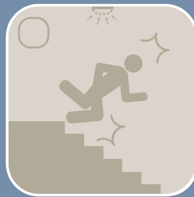
非常照明の不具合