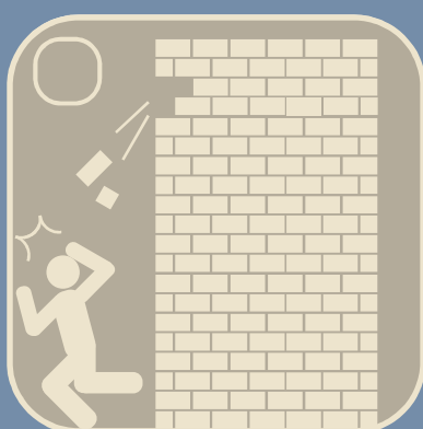
外壁の剥離・落下