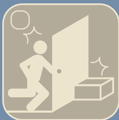
避難経路上の障害物