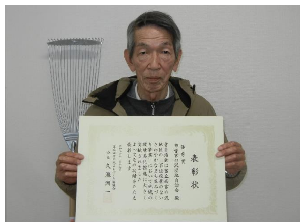
市営宮の沢団地自治会