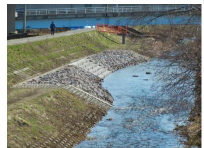
三樽別川左岸の様子 (4月1日撮影)

工事は昨年11月から始まっていて、今年2月に左岸側の工事がいったん終了。11月頃から再開され、来年3月には完成の予定です。これまで活動を続けてきた地域の方々や子どもたちは完成をとても楽しみにしています。