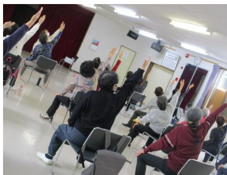
<椅子ヨガ・笑いヨガの様子>