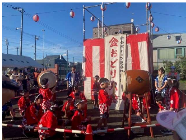
【昨年の様子:わらび連合町内会】