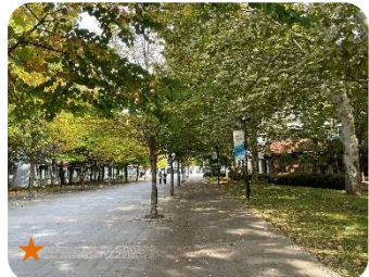
北海道科学大学キャンパス