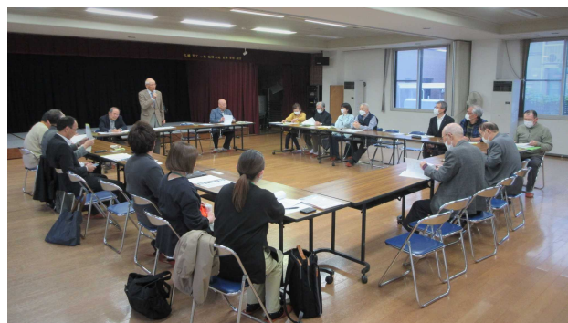
（稲積安全・安心まちづくり協議会定期総会）