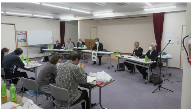
（前田ふれあいまちづくり協議会定期総会）