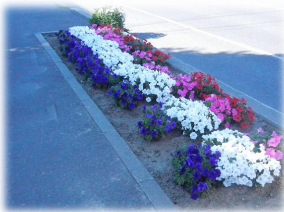
(きれいに彩られた稲山通の花壇)

【10月】稲山通で植樹ますの花壇の管理をしている「わらび南町内会女性部わらび南花壇くらぶ」が「ます花壇優良製作者」として札幌市建設局長より表彰されました。