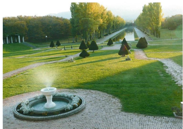
審査員特別賞 手稲鉄北小学校1年生 「夕ぐれのふん水と前田森林こうえん」 ※審査員特別賞は、この他3点の作品が選ばれて います。