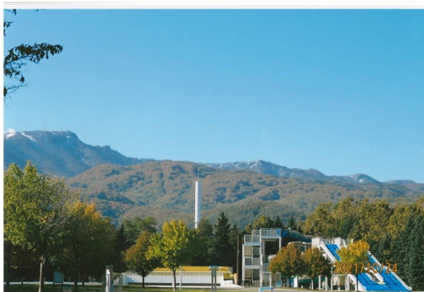
優秀賞 前田中央小学校4年生 「さくごしの手稲プール～来年こそは プールに入りたい！」