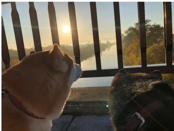
最優秀賞 前田北小学校1年生 「まえだしんりんこうえんばしから あさひをみたよ。」

応募作品は、1月13日から16日までの間、手稲駅あいくるで展示されますので、ぜひお立ち寄りください。