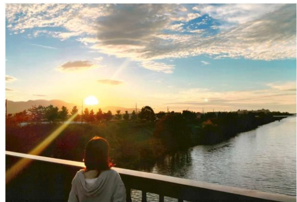
優秀賞 前田中央小学校4年生 「宝石みたいな夕陽」