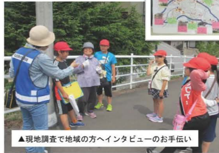
▲現地調査で地域の方へインタビューのお手伝い