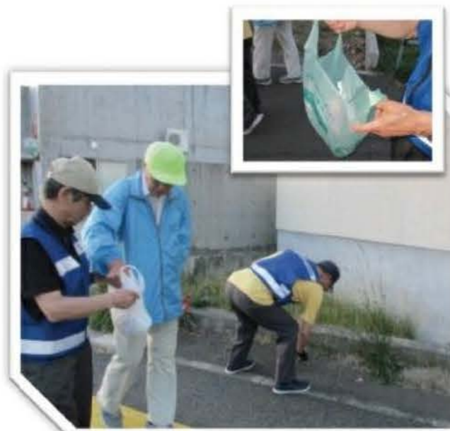
▲パトロールの途中には歩道のゴミも拾っています「タバコの吸い殻がたくさん落ちています」