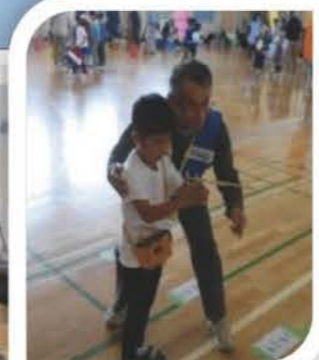
▲割りばし鉄砲的あてゲームに挑戦