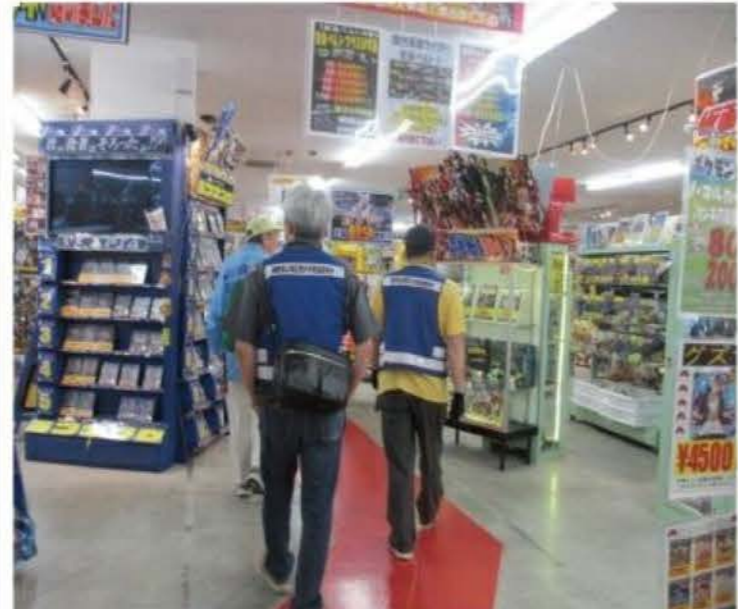
▲遅い時間帯に子どもだけで来ていないか、店内を確認します