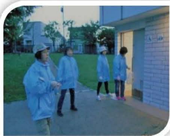
▲地域の公園をパトロール「不審者はいないか？」

全国で子どもが被害に遭う痛ましい事件が発生しています。手稲区でも不審者の出没情報が相次いでおり、子どもたちが事件に巻き込まれることなく安心して過ごせるように、稲穂地区と金山地区で定期的に公園や商業施設、JR 駅などを巡回し、不審者はいないか、夜遅い時間まで遊んでいる子どもはいないか、パトロール活動をしています。公園では、不審者の隠れ場所になりそうな樹木や草むらが無いかについてもチェックし、危険なところを見つけたら、関係機関に連絡して対応をお願いしています。