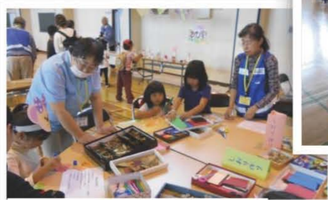
▲押し花を使ってしおりづくりを体験