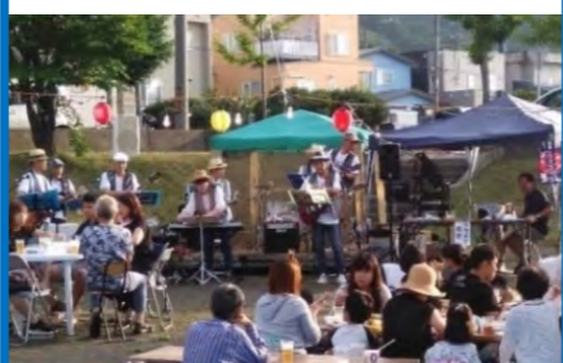
金山ニューサウンズによるヒット曲演奏 に大盛り上がり♪(金山みはらし公園)