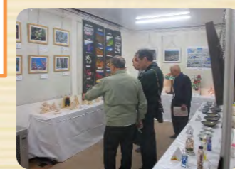
日ごろの成果を発表