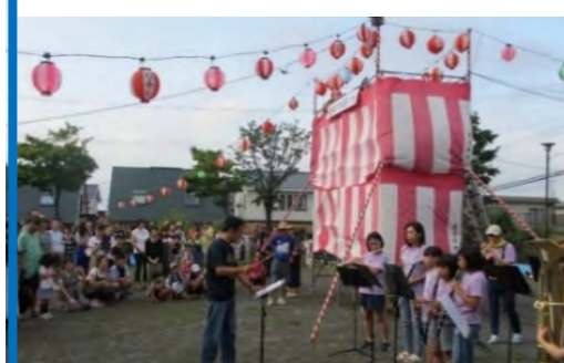
手稲西小学校スクールバンドによる 演奏に拍手喝采♪(金山滝見公園)