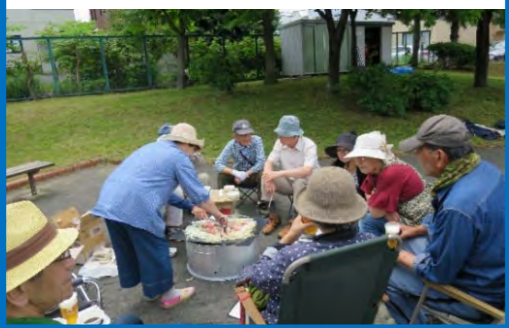
特製ジンギスカン鍋とキノコ汁に舌鼓♪ (稲穂そよかぜ公園)