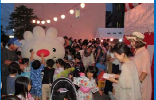
ていぬくん登場!子ども達から大人気♪ (稲穂会館駐車場)