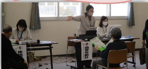
健康エリア(会館2階)

参加費は無料♪参加された方に「 ていぬイラスト入りタオル 」と 粗品をプレゼント します！