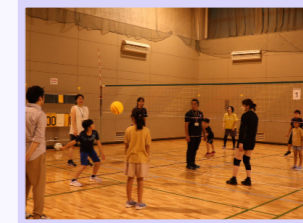
スポーツ・レクリエーション祭