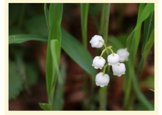
富丘西公園のスズラン