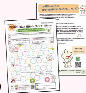
朝食レコーディングといきいきウォーキング