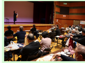
防災リーダー研修会