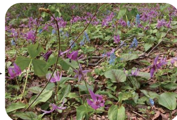
■ 見通しが良くなり、カタクリやエゾエンゴサクなどがびっしり開花するようになりました。(2011年)