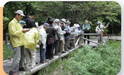
写真：第23回自然観察会、2011.6.5