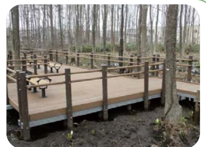
観察デッキにはベンチや手すりも新設

緑地内を回遊できるよう、線路側に新しい木道のルートが設けられ、たくさんの植物を身近に観察できるようになりました。また、拡幅によって車椅子でも安心して利用できるようになったほか、ベンチも新たに設置されています。