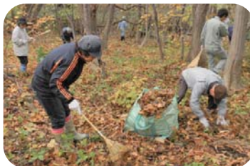
■ 落ち葉や枯れ枝をかき集めて運び出します。

カタクリを保全するには、春の生育期に良く日の当たる環境を作ること、タネから新しい個体を増やしていくことが大切です。そのため、秋のうちに日陰を作るササを刈り、種子の定着や幼体の生育を妨げるリター（落葉や枝や樹皮などの植物の未分解物）をよけて、カタクリが春を迎える準備をしておきます。