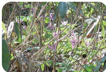
■ 保全作業を始める前は、カタクリがササと枯れ葉に覆われていました。(2004年)