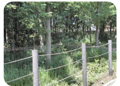
木道が見通せるようになった東側入口