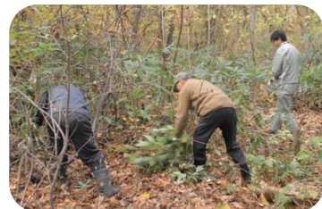
■ ササは毎年刈取することで勢力が弱まってきています。