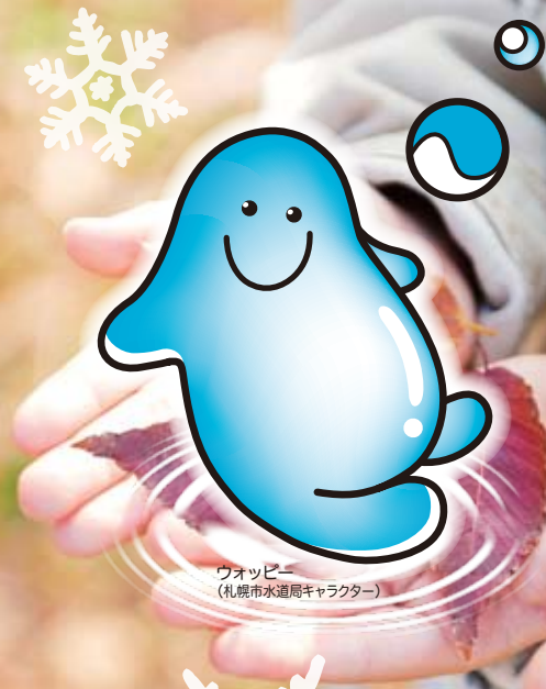
ウォッピー (札幌市水道局キャラクター)