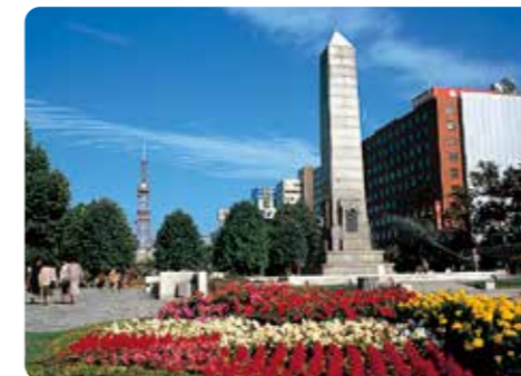
大通公園 (中央のモニュメントは札幌の水道 創設を記念して建てられたもの)