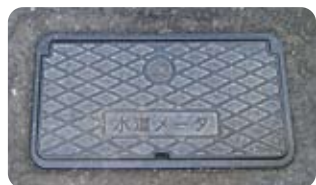
水道メーターが格納されているメーターボックス

※1:利用状況により一部のみ毎月検針 ※2:水道メーターの有効期限は計量法により8年