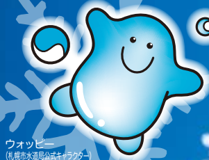
ウォッピー (札幌市水道局公式キャラクター)