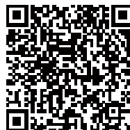
札幌市水道局ホームページ (石狩西部広域水道企業団への参画)