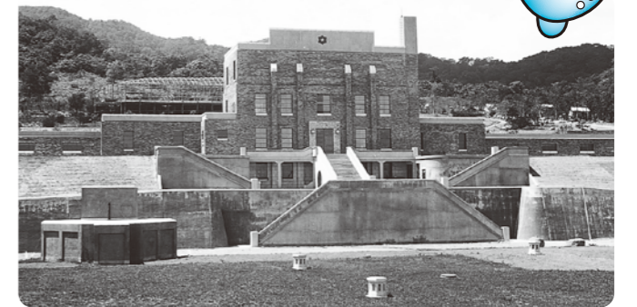
完成したころの藻岩浄水場(昭和12年)

3年後の昭和12(1937)年、藻岩浄水場をはじめとする水道施設が完成し、1万8千戸、9万2千人に水を送ることができるようになりました。これは当時の札幌の人口20万4千人のおよそ45パーセントにあたりました。