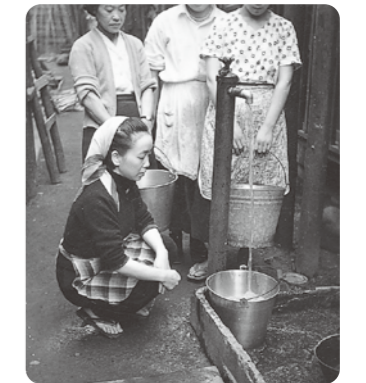
昭和12年～35年ころの水道