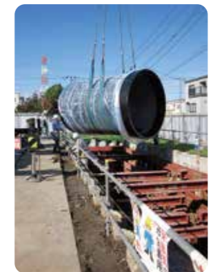
緊急貯水槽設置のようす