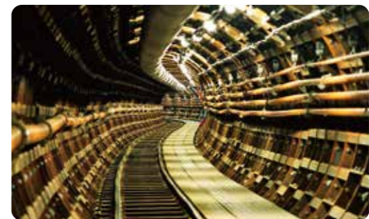
白川第3送水管の工事のようす