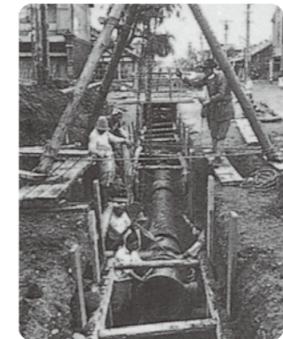
水道管工事のようす