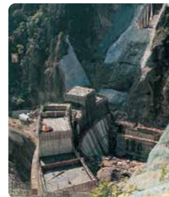
豊平峡ダム工事のようす

昭和63年ころからは、安全な水をどんなときでも送れるように、水道施設の整備や定山溪ダムの建設などを進めるとともに、近年では、水道施設の耐震化や緊急貯水槽の設置など災害に強い水道づくりを進めています。