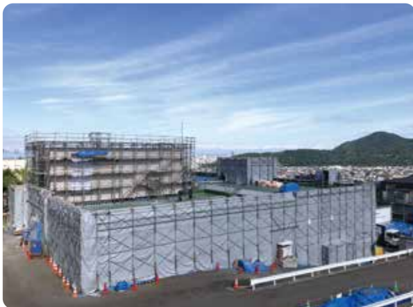
西野浄水場の改修工事のようす 【令和元(2019)～5(2023)年】

これからも安全でおいしい水道水をみなさんにとどけるために、修理や建て直しを行っています。