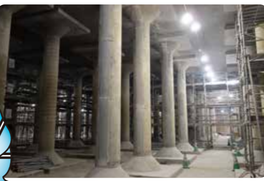
西部配水池の耐震化工事の様子

地震がおきたとき、地震のゆれで赤い矢印の方向に引っぱられても、管Aのでっぱりがロックリングにひっかってぬけない