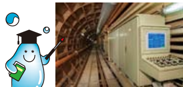
▲新しい送水管を入れるためのトンネル内の様子。