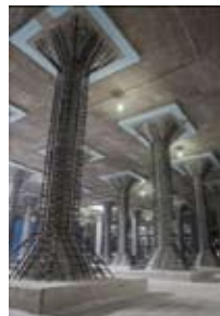
▲耐震化工事中の配水池内の様子

配水池の耐震化は約7割が完了し、現在は市内で一番大きな平岸配水池の耐震化工事を行っています。