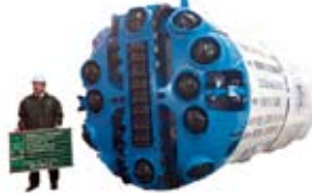
▲シールドマシンという機械を使ってトンネルを掘っていきます。