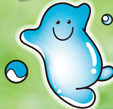
ウォッピー (札幌市水道局キャラクター)