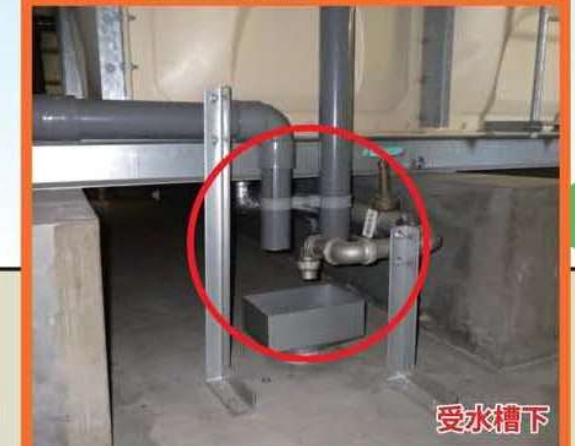
水抜き用バルブ等