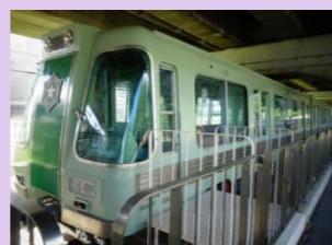
【南北線営業第1号車】