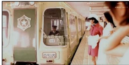
＜HP トップページの画像＞