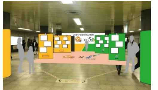
＜パネル展の開催イメージ＞

地下鉄大通駅構内にて、両者の歴史を紹介するパネル展を開催（12月16日～1月10日） また、隣接する通路で記念フォトスポットと歴史年表を展示（12月16日～3月27日）