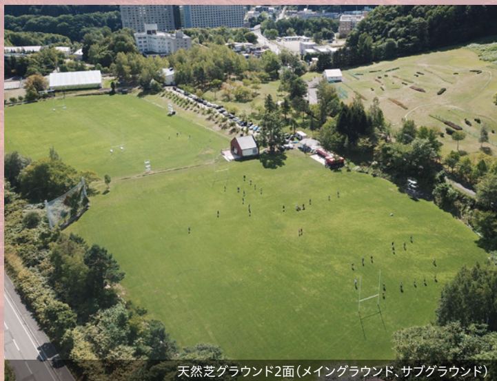
天然芝グラウンド2面(メイングラウンド、サブグラウンド)