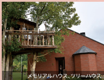
メモリアルハウス、ツリーハウス