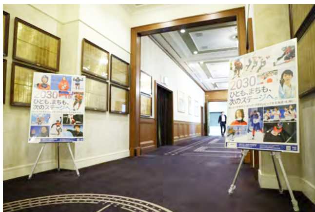
会場入り口の様子。新たなデザインの招致ポスターが置かれていた。

できているんだなということをもっと感じた。オリンピックというゴールに向かって続けていくということは、オリンピックを越えてからもきつと成立する良い事業になっていくのではないかな。まずは今日のような機会に皆さんと垣根なくお話をしながら気づきを築き上げていくということが大切。」