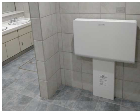
<設置したおむつ交換台>

この寄附で、東西線円山公園駅と東西線大通駅構内の新たに改修したトイレにおむつ交換台を設置させていただきました。