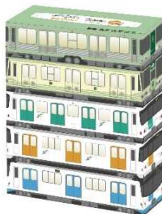
<ボックスティッシュ外観>

地下鉄デザインのボックスティッシュを製作し、セイコーマート全店舗で販売しました（限定 10 万セット）。