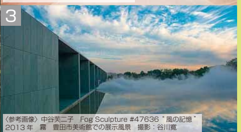
〈参考画像〉中谷芙二子 Fog Sculpture #47636 “風の記憶” 2013年 霧 豊田市美術館での展示風景

エキシビション 展覧会 日程 7/19(土)~9/28(日) 会場 道立近代美術館、芸術の森美術館、駅前通地下歩行空間、道庁旧本庁舎「赤れんが」など 「都市と自然」をテーマにさまざまな展示を行います。