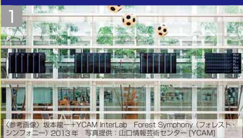
〈参考画像〉坂本龍一+YCAM InterLab Forest Symphony (フォレスト・シンフォニー) 2013年