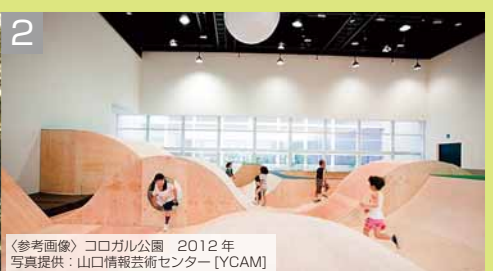
〈参考画像〉コロガル公園 2012年