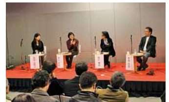
↑これまでに2回開催。芸術祭に関する基礎知識や映像を用いた芸術分野「メディアアート」などをテーマに解説しました

申込 電話、ファクス、Eメール。氏名、年齢、電話番号、ファクス番号、Eメールアドレスを記入し、2/9(日)までに市コールセンター(1ページ)へ。多数時抽選