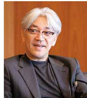
札幌国際芸術祭 2014 ゲストディレクター さかもと りゅういち 坂本 龍一

1952年生まれ。1978年にアーティストとしてソロデビュー。同年、「YMO」を結成。散開後は、音楽と芸術を横断する柔軟な視点や、歴史・哲学など幅広い知識を生かし、メディアの枠を超えて活動している。