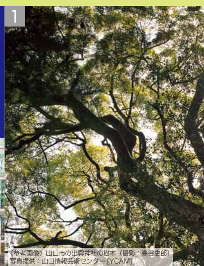
〈参考画像〉山口市の出雲神社の樹木