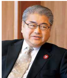
札幌市長 うえだ ふみお 上田 文雄