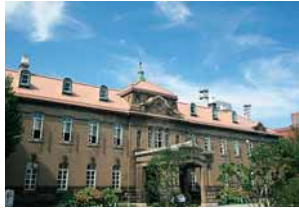
↑札幌控訴院庁舎として大正15年に建てられた資料館。現在は展示室などに活用されています

申込 市役所2階国際芸術祭担当、下記ホームページで詳細を確認の上、氏名、住所、年齢、電話番号、Eメールアドレスを記入し、3/31(月)までにEメール(shiryokan@siaf.jp)で登録し、4/30(水)までに申し込み。