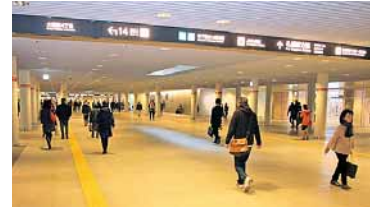
↑受賞作品は、期間中、資料館や芸術の森美術館、駅前通地下歩行空間などの会場で流れます

申込 市役所2階国際芸術祭担当、下記ホームページで詳細を確認の上、3/31(月)までに作品をホームページに登録。